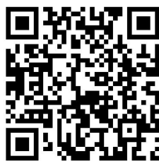
14.（跨省）国家异地就医备案